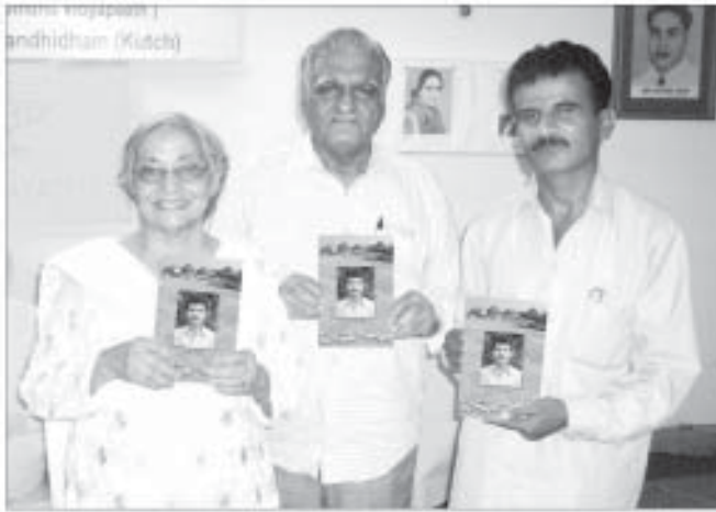
رچنا- ۱۲۱ جي رونمايي ڪرڻ مهل برک ليڪڪا ڪلا پرڪاش، ڪلاڌر مٿوا ۽ لڪمي ڪلاڻي ۽ سان گڏ