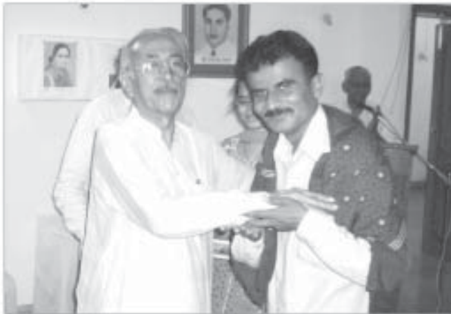
’رچنا‘ ڪهاڻي چٽاڀيٽي ۽ پر پهريون انعام کٽڻ لاءِ ڪلاڌر مٿوا کي ڊاڪٽر ستيش روهڙا اجرڪ پهراڻي سندس سمنان ڪري رهيو آهي